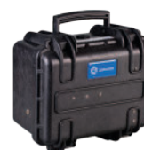
SB 275 Wetterfester Zusatzakku 33 Ah