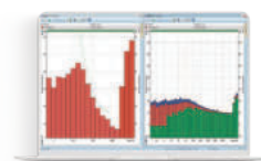
SF 307_3 Frequenzanalyse im Terz- und Oktavband