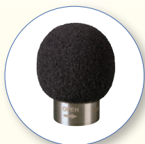
SA 122A Protetor de vento extra