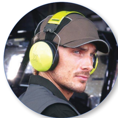
Hearing Protectors Evaluation in accordance to ISO 4869-2