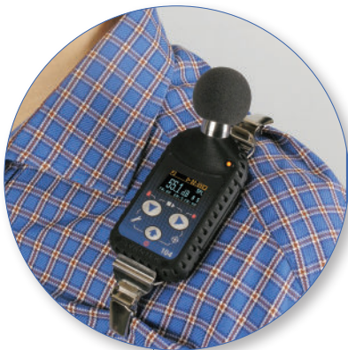
ISO 9612 baseada em tarefa, baseada em trabalho, estratégias de dia inteiro