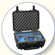
SA 147 Case a prova d'água