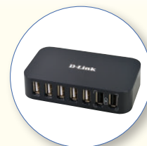
SA 156 USB para 5 dosímetros