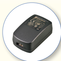
SA 54 carregador USB