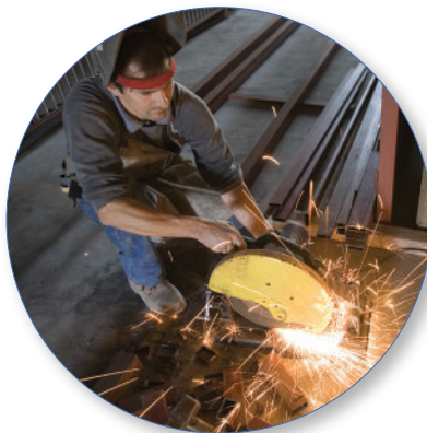
TWA e DOSE de acordo com OSHA, ACGIH, MSHA