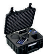
SA 72 Walizka transportowa