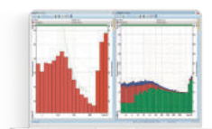
SF 971A_P1 Pakiet opcji pomiarowych; analiza oktaowa, tercjowa oraz zapis audio