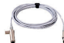
SC 91A Przedłużacz do przedwzmacniacza SV 18A