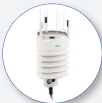
SP275 Stazione meteo basata su modulo VAISALA