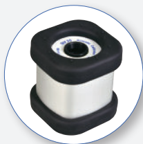
SV36 Calibratore Acustico Classe 1 94 dB / 114 dB a 1 kHz