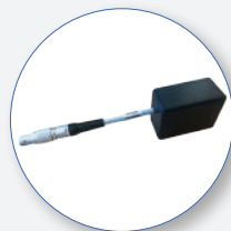
SP200 Adattatore LAN