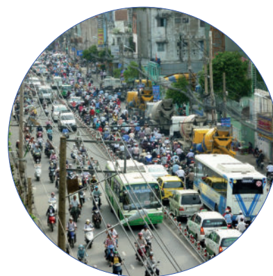
Monitoraggio del rumore esterno ambientale