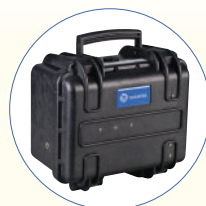
SB270_EB Pacco Batteria esterno da 33Ah