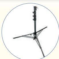
SA206 Stativo per kit di protezione microfonico