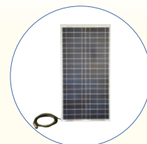
SB270_SP Pannello solare