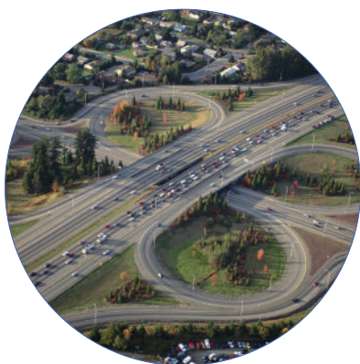
Monitoraggio del traffico stradale