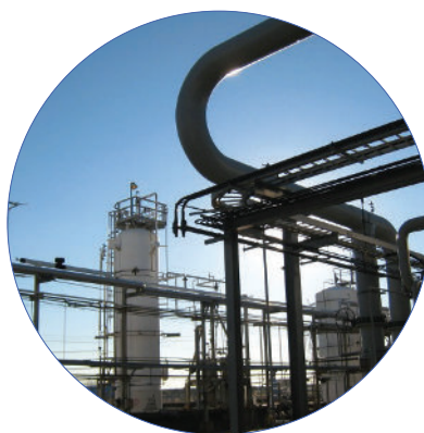
Monitoraggio delle emissioni rumorose