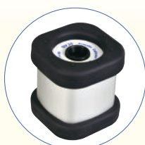
SV35 Calibratore Acustico in Classe 1, 94 dB / 114 dB a 1 kHz