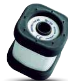
SV 34B Akustischer Kalibrator 114 dB / 1 kHz