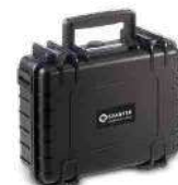
SA 147B Wetterfester Transportkoffer für Dosimeter und Dockingstation